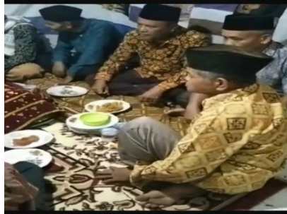
Gambar 3. Peran Urang Tuo secara adat

kepadanya (Amiman, 2022). Urang Tuo adalah seseorang yang dituakan dan di pilih di suatu kampung (Harmaini & Anwar, 2019). Gelar Urang Tuo berikan kepada seseorang yang dianggap mampu untuk menjalankan tugas sebagai Urang Tuo . Masa jabatan Urang Tuo berlangsung lama yaitu mulai dari di pilih menjadi Urang Tuo hingga orang tersebut meninggal dunia. Urang Tuo merupakan seseorang yang dipilih dan dipercaya oleh masyarakat untuk pimpinan di suatu kampung kecil yang berada di suatu korong untuk menjadi tempat bermusyawarah mufakat dalam hal adat seperti upacara pernikahan, kematian, penyelesaian konflik dalam masyarakat dan lainnya.