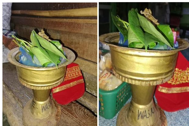
Gambar 2. Siriah dalam carano