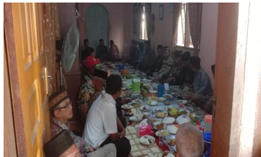
Gambar 2. Pihak yang terlibat dalam proses penentuan nominal, negosiasi piti sasuduik dan manantuan hari

Proses negosiasi piti sasuduik memiliki empat tahapan yaitu proses yang pertama, niniak mamak laki-laki dan perempuan naik ke rumah calon mempelai perempuan. Pihak keluarga perempuan sudah berada di dalam rumah untuk menyambut niniak mamak laki-laki dan pihak keluarga laki-laki. Makanan untuk menyambut niniak mamak laki-laki dan perempuan beserta daun siriah sudah terhidang di ruang tamu. Kedua, setelah niniak mamak dan kedua pihak keluarga selesai makan, selanjutnya pangulu pihak laki-laki memakan daun siriah untuk membuka pembicaraan mengenai proses negosiasi yang dilaksanakan dengan niniak mamak perempuan. Ketiga, niniak mamak laki-laki menyampaikan maksud dan tujuan, serta menyampaikan alasan mengapa anak kamanakan tidak menyerahkan piti sasuduik yang sesuai dengan permintaan keluarga perempuan. Niniak mamak laki-laki mewakili anak kamanakan yang menjadi tanggung jawabnya dalam adat dan sukunya, pihak keluarga laki-laki harus menerima apapun hasil keputusan niniak mamak perempuan dan pihak keluarga perempuan. Keempat, niniak mamak perempuan akan bermusyawarah dan menimbang serta memutuskan kelanjutan pernikahan untuk kamanakan nya. Jika negosiasi ini berhasil atau diterima oleh niniak mamak perempuan dan sesuai kesepakatan dengan keluarga, niniak mamak perempuan akan memakan sirih , tetapi jika niniak mamak perempuan kembali berbicara atau tidak memakan sirih tandanya negosiasi ditolak.