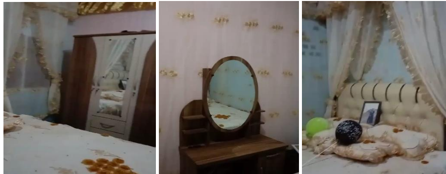
Gambar 1. Isi sasuduik yang diperlihatkan pada acara baralek Sumber: Dokumentasi Wila, Situjuh Banda Dalam, 29 Agustus 2023

menarik antara transaksi angka-angka terhadap jumlah uang yang diberikan dan uang yang diterima. Secara strukturalisme, proses penentuan nominal dan negosiasi serta faktor-faktor dalam menentukan jumlah piti sasuduik menunjukkan pertukaran komunikasi antara dua keluarga dan pertukaran simbolis yang dilambangkan dengan daun siriah , melalui proses negosiasi yang dilakukan oleh kedua pihak keluarga dan kedua niniak mamak didapatkan dua hasil yang bertolak belakang yaitu diterima dan ditolak. Penelitian ini menunjukkan proses negosiasi piti sasuduik tidak selalu terjadi, karena kedua pihak keluarga telah membuat kesepakatan sebelum meminta persetujuan niniak mamak mengenai jumlah piti sasuduik yang diberikan oleh pihak laki-laki.