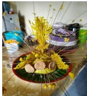
Gambar 4. Ganggah

Ganggah merupakan makanan hantaran yang berbentuk hiasan yang disajikan oleh bako . Makanan ini dihias sedemikian rupa dengan bantuan lidi dan dibentuk seperti bunga yang mekar dan megah, bahan dalam pembuatan ganggah adalah tepung beras dan tepung ketan. Ganggah dibawa atau dijujuang dengan talam oleh seorang bako . Simbol ganggah bermakna kemegahan, kegembiraan dan kesuksesan, di mana hal tersebut berkaitan dengan perekonomian bako , jika seorang bako berada dalam kategori menengah ke atas maka ganggah yang dibawa saat maarak anak ini banyak atau lebih dari satu. Namun jika ekonomi bako rendah, ganggah ini tidak ada bahkan ada yang tidak maarak an anak pisang nya. Jika dalam maarak anak , ganggah ini tidak ada maka akan terlihat bahwa kurang sempurnanya acara tersebut.