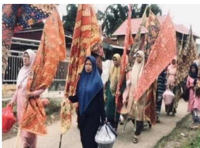
Gambar 2. Kain Panjang

Dalam kebudayaan Minangkabau, kain panjang menempati posisi khusus dalam legitimasi adat. Mengutip dari kebudayaan.kemdikbud.go.id , masyarakat Minangkabau menempatkan kain panjang sebagai peralatan bernilai tinggi sekaligus sebagai bentuk penghormatan dalam kebudayaan. Kain panjang yang digunakan dalam tradisi maarak anak di Nagari Tabek Patah dibeli oleh bako dan orang yang dipanggia bako untuk anak pisangnya dan saat pelaksanaan iringi-iringan, kain panjang dibawa dengan diikat memanjang ke tonggak atau kayu seperti marawa dan dibawa oleh bako dan kerabat lain yang ikut serta dalam arak-arakan tersebut.