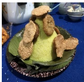
Gambar 5. Salomak Kuniang

Salomak kuniang merupakan makanan tradisi dan simbol makanan adat yang biasa disajikan untuk menjamu niniak mamak dan tokoh masyarakat yang hadir dalam berbagai upacara adat, maka dari itu masyarakat Tabek Patah menjadikan salomak kuniang bentuk hantaran dalam tradisi maarak anak , sehingga masyarakat mengartikan salomak kuniang sebagai kapalo adek yang tidak boleh ditinggalkan dalam tradisi apapun. Dalam tampilannya salomak kuniang didampingi oleh botiah dan pinyaram yang ditusuk di sisi atas dan samping salomak kuniang tersebut yang dijadikan sebagai pelengkap dan penyempurna bentuk dari salomak kuniang .