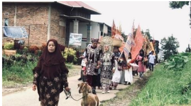
Gambar 3. Kambiang

Kambing menjadi salah satu hewan ternak yang bernilai bagi masyarakat di Nagari Tabek Patah, karena menjadi hantaran yang dibawa oleh bako saat melaksanakan maarak anak dan menjadi hak anak pisang setelah maarak anak tersebut selesai dilaksanakan. Simbol kambing yang dibawa saat maarak anak tidak boleh diuangkan, karena kambiang tersebut merupakan suatu perwujudan yang harus diperlihatkan saat bararak , hal tersebut dapat dilihat dari urutan iringi-iringan saat maarak anak , di mana kambing tersebut berada pada urutan pertama iring-iringan dan berjalan di depan anak daro , namun setelah pelaksanaan maarak anak dan acara barolek , kambing yang telah menjadi hak anak pisang tersebut boleh diuangkan ataupun ditenakkan sesuai kebutuhan anak pisang .