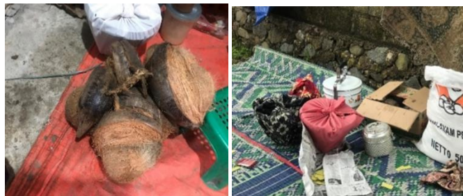
Gambar 6. Boban

Boban merupakan hadiah yang dibawa oleh bako dan kerabat terdekat dari pihak bako yang berisi beras atau padi, kelapa, kado dan lain-lain Boban memiliki beberapa bagian, yang pertama boban dari induk bako berupa beras atau padi sebanyak 10 gantang , kelapa 4 sampai 8 buah dan kado yang dikhususkan untuk anak pisang , sementara boban yang dibawa oleh orang yang dipanggia oleh bako hanya berupa padi atau beras dengan jumlah yang lebih kecil dari pada boban bako serta kado khusus tergantung kedekatan hubungan orang yang dipanggia dengan anak pisang . Simbol tersebut bermakna pertolongan bako untuk kehidupan anak pisang setelah menikah, hal tersebut dapat dimanfaatkan sebaik-baiknya sesuai dengan kebutuhannya.