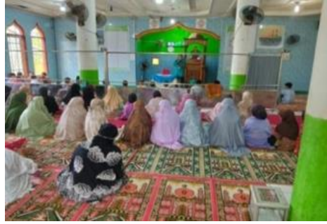
Gambar 7. Program penyuluhan kesehatan di Puskesmas