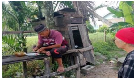
Gambar 2. Masyarakat berobat Tradisional