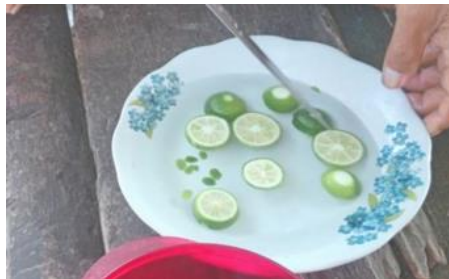
Gambar 3. Obat Limau