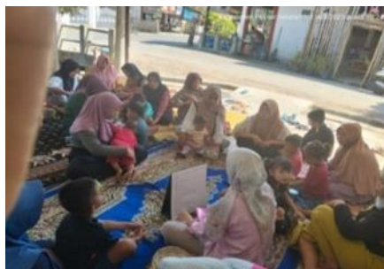
Gambar 6. Program penyuluhan kesehatan di Puskesmas

".... Kunjungan masyarakat Tanjung Durian ke pengobatan modern atau ke bidan desa umumnya cukup tinggi, terutama dalam pemeriksaan kehamilan dan persalinan, selain itu juga keluhan masyarakat adalah demam, batuk, pusing, sakit kepala dan diare. Alasannya karena akses yang dekat dengan bidan desa sehingga masyarakat tidak harus pergi jauh untuk berobat. Terkait pengetahuan masyarakat juga di Nagari bidan memberikan penyuluhan kesehatan, edukasi tentang nutrisi, dan gaya hidup sehat kepada masyarakat...." (Wawancara pada 5 Agustus 2025).