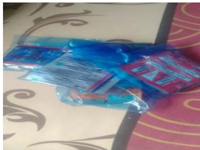
Gambar 5. Obat medis informan