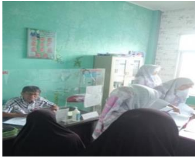
Gambar 4. Masyarakat berobat ke puskesmas