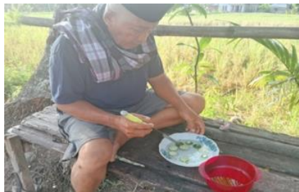
Gambar 8. Pengobatan Tradisional

"....Disini kita kebanyakan masyarakat fifty-fifty, ada yang masih mempercayai obat non-medis (tradisional) seperti obat limau, ramuan. Sebahagian ada juga yang percaya ke medis seperti ke puskesmas, bidan, bkm dan balai-balai kesehatan lainnya, tapi secara garis besar kalau sekarang di kampung ini masih ke non-medis, tapi kalau sudah tidak sanggup ke dukun kampung baru di bawa ke rumah sakit, tapi selagi bisa ditangani oleh dukun kampung itu akan di dukun kampung saja. Keluhan yang biasa dibawa berobat ke dukun kampung tu beragam penyakit, kayak kesurupan, sakit kepala, demam, pilek bahkan penyakit dari kecelakaan itu ke dukun kampung juga. Dukun kampung dari dulu bisa menyembuhkan segala macam penyakit dan cara pengobatannya itu menggunakan asam limau, ramuan obat, daun-daunan obat yang bisa diolah menjadi minuman obat. Pertimbangan masyarakat itu kadang lebih dahulu ke dukun kampung itu karna ada kendala di pelayanan medis, ada yang tidak punya BPJS, repot karena antrean, kurang ditanggapi dan kurang dilayani. (Wawancara 3 Agustus 2025).