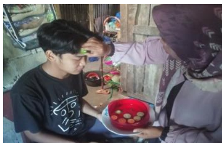
Gambar 9. Pengobatan Tradisional