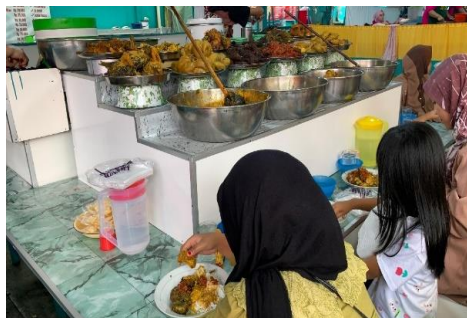
Gambar 4. Warung Nasi Kapa Hj. Mes