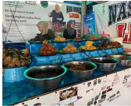
Gambar 2. Nasi Kapau Linda

pedagang nasi kapau (Erawati, 2024). Dari waktu ke waktu, kawasan ini berkembang menjadi pusat kuliner yang tidak hanya dikunjungi masyarakat lokal, tetapi juga menjadi daya tarik wisatawan.