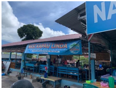
Gambar 3. Warung Nasi Kapau Linda

Menu yang disajikan oleh penjual nasi kapau memiliki ciri khas tersendiri yang membedakannya dari rumah makan padang pada umumnya. Salah satu yang paling menonjol adalah keberadaan gulai kapau , yaitu gulai sayur yang biasanya terdiri dari campuran nangka muda, kacang panjang, kol, dan aneka sayuran lain yang dimasak dengan bumbu rempah yang khas. Selain itu, terdapat gulai tunjang , dendeng batokok , ayam randang , dan ikan batalua . Namun, lauk yang paling identik dengan nasi kapau adalah gulai tambusu , yaitu usus sapi yang diisi dengan campuran telur dan bumbu rempah, kemudian dimasak dalam kuah gulai . Cara penyajian juga memiliki keunikan tersendiri, yaitu lauk pauk disusun bertingkat di meja panjang, sementara penjual menggunakan sendok panjang untuk mengambil lauk dari wadah-wadah besar, sebuah teknik penyajian tradisional yang masih dipertahankan hingga kini.