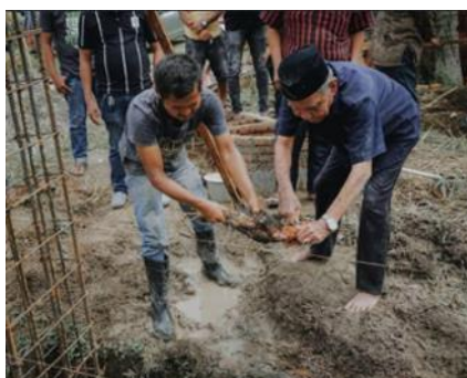
Gambar 3. Proses penyembelihan ayam dan mendarahi tiang-tiang rumah

Penyembelihan ayam di atas tumpukan batu memiliki makna simbolis sebagai pertanda. Setelah disembelih, ayam diletakkan di atas tumpukan batu. Jika ayam mati tepat di tempat pertama kali diletakkan, masyarakat meyakini hal tersebut sebagai pertanda baik. Sebaliknya, apabila ayam yang disembelih terlempar ke luar dari tumpukan batu, hal itu dianggap sebagai pertanda buruk dan dapat membawa malapetaka bagi pemilik rumah.