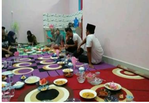
Gambar 4. Syukuran dan makan bersama