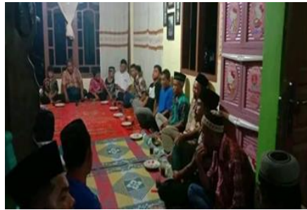
Gambar 2. Acara persiapan upacara buka abo dengan mengumpulkan ninik mamak

digunakan harus ayam betina, sesuai dengan tradisi Minang. Namun, ada juga pendapat bahwa pemilihan ayam tergantung pada permintaan tukang bangunan, dan penggunaan ayam jantan juga diperbolehkan meskipun lebih umum memakai ayam betina. Jadi, baik ayam betina maupun jantan bisa digunakan, tetapi ayam betina lebih sering dipilih karena alasan budaya.