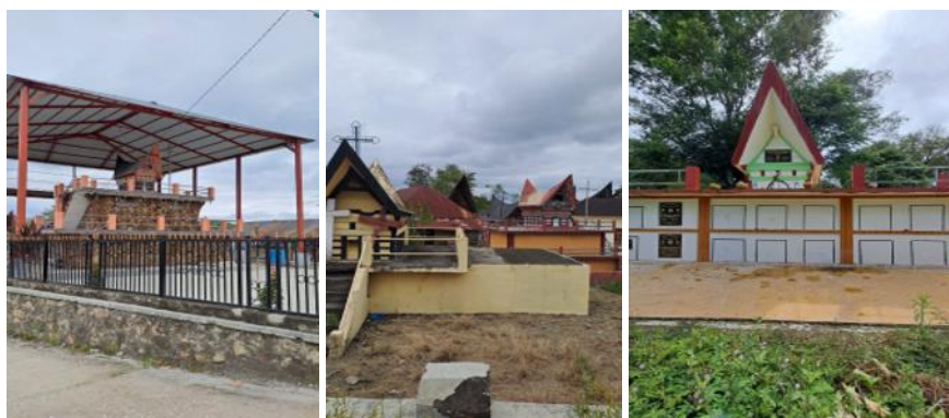
Gambar 3. Kuburan ( simin/tambak ) orang Batak Toba di Desa Simarmata

Ketika orang Batak meninggal dunia di tempat kelahiran maupun perantauan, maka jenazah atau tulang belulanganya dibawa pulang ke tanah kelahiran ( bona pasogit ). Hal tersebut menyebabkan setiap keluarga atau pun marga memiliki kuburan ( simin/tambak ) masing-masing. Pada umumnya bangunan simin (kuburan) memiliki dua bagian, bagian atas dan bawah. Bagian bawah terdiri dari beberapa ruangan atau lubang, ini digunakan sebagai tempat jenazah yang baru meninggal. Bagian atas terdiri dari satu ruang atau lubang berfungsi sebagai tempat penyimpanan tulang belulang jenazah yang sebelumnya dibawah. Bangunan simin (kuburan) biasanya dimiliki oleh keluarga besar atau disebut sada oppung (satu leluhur).