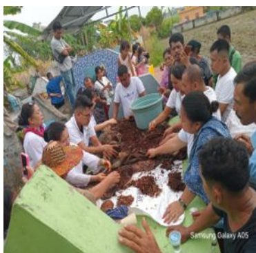
Gambar 2. Pembongkaran kuburan di tanah rantau

Mangokal holi dapat diartikan sebagai kegiatan menggali tulang-belulang orang meninggal untuk dipindahkan ke tempat baru yang diikuti dengan pesta adat. Tradisi mangokal holi dilaksanakan setelah beberapa tahun seseorang atau leluhur dikuburkan. Tradisi mangokal holi tidak hanya berlaku saat di bona pasogit (tanah kelahiran) saja, namun juga berlaku jika jenazah orang tua atau leluhur berada di tanah perantauan. Jenazah yang dikuburkan di tanah perantauan dibawa ke bona pasogit (tanah kelahiran) sebagai tanda penghormatan (Lumban & Vioreza, 2024).