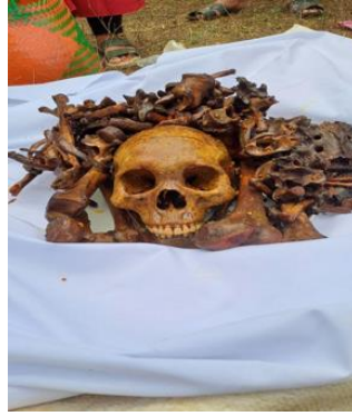
Gambar 4. Tulang belulang disusun di atas piring putih