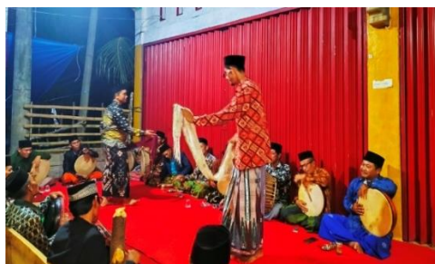
Gambar 3. Penampilan seni dendang diacara pernikahan

Dari pernyataan informan di atas dapat disimpulkan bahwa upaya mengenalkan seni dendang ke generasi muda dilakukan oleh sanggar dengan cara menampilkan seni dendang di acara-acara adat seperti pernikahan, aqiqah dan sunat rasul jadi secara tidak langsung disana sanggar seni Tiga Serangkai tidak hanya tampil untuk memeriahkan pesta pernikahan atau aqiqah tetapi juga mengenalkan seni dendang ke masyarakat luas terutama generasi muda.