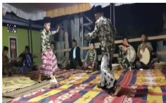
Gambar 4. Generasi Muda Belajar Seni Dendang

“... seminggu dua sampai tiga kali latihan, tetapi khusus untuk kami anggota muda latihan cuman satu kali dalam seminggu setiap malam minggu. Hal tersebut mengingat kami anggota muda masih sekolah dan takut mengganggu proses belajar kami. Oleh sebab itu latihan dilakukan di malam minggu supaya tidak mengganggu waktu belajar kami...” (wawancara 14 Januari 2025).