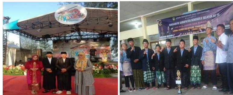
Gambar 5. Generasi Muda Lomba Seni Dendang

Berdasarkan hasil penelitian dapat diambil kesimpulan bahwa keikutsertaan kalangan muda dalam perlombaan-perlombaan, baik di tingkat Kecamatan maupun tingkat Kabupaten dapat membuat anggota sanggar menjadi disiplin untuk latihan. Selain itu mereka juga tidak merasa bosan dengan kegiatan mereka yang hanya sekedar latihan dan latihan saja. Mereka merasa ada tantangan dan tujuan yang ingin dicapai. Dengan itu anggota sanggar terutama anggota muda merasakan perlunya latihan secara serius agar bisa meraih apa yang menjadi target mereka.