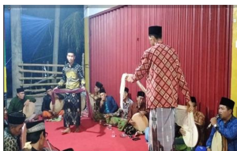
Gambar 2. Penampilan Seni Dendang

Seni dendang atau yang sering disebut oleh masyarakat Serawai dengan bedendang (berdendang) adalah suatu kesenian berbalas pantun yang diiringi dengan tarian dan alat musik tradisional yang dilakukan oleh laki-laki. Pantun ini berisi nasehat orang tua kepada anak, etika pergaulan, percintaan, dan sebagainya. Seni dendang terbagi menjadi dua macam pertunjukan yaitu bedendang nunggu nasi masak dan bedendang mutus tari (Hasanadi, 2018). Pertunjukan seni dendang yang dimainkan di atas panggung yang dalam bahasa sehari-hari masyarakat Suka Bandung sebut dengan pengujung. Seni dendang dimainkan oleh sekelompok laki-laki dengan menggunakan pakaian yang rapi yakni memakai baju lengan panjang atau jas, memakai kain sarung, dan kopiah (Yoesoef et al., 2023).